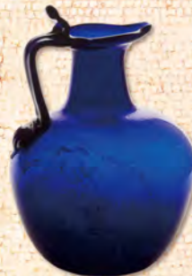
青い水差し 三葉形の口を持つ オィノコエ(酒器)