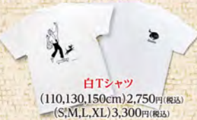
白Tシャツ (110,130,150cm)2,750円(税込) (S,M,L,XL)3,300円(税込)