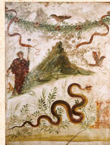
バックス(ディオニソス)とヴェスヴィオ山 大噴火直前のヴェスヴィオ山が描かれたフレスコ画