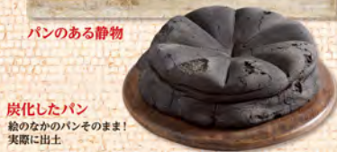
炭化したパン 絵のなかのパンそのまま！ 実際に出土