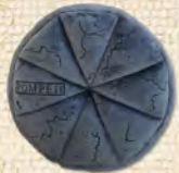
炭化したパンのクッション 4,950円(税込)

ポムポムプリンコラボグッズ © 2022 SANRIO CO., LTD. APPROVAL NO. L625577