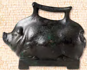
仔ブタ型の鉢 ブロンズ製の機能的な日用品が多数発見された