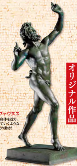
踊るファウヌス 激しく身体を捻り、 上昇していくような 螺旋状の動き!