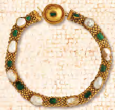
エメラルドと 真珠母貝のネックレス 遠方からの貴重な素材を ふんだんにあしらった装身具