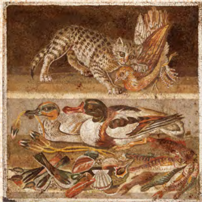
ネコとカモ 豊かな食材と、それを扱うネコのユーモア