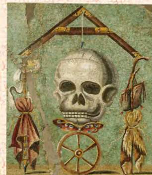
テーブル天板 通称「メメント・モリ」 死と隣り合わせ、だから今を楽しもう。古代ローマの人生観を示すモザイク