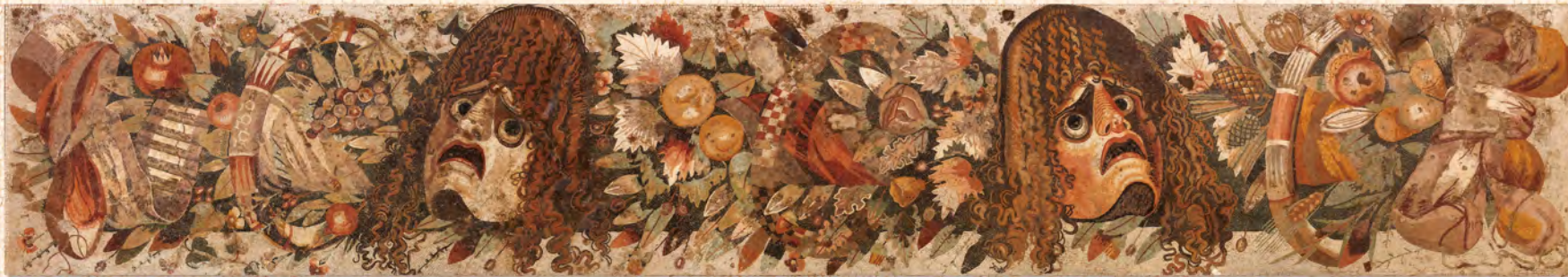
葉網と悲劇の仮面 家の豊かさ、家の主人の教養の高さがうかがえる