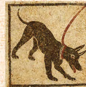
猛犬注意 家の玄関に敷かれた床モザイク