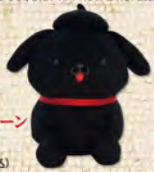
ぬいぐるみ ボールチェーン マスコット 1,540円(税込)

ポムポムプリンコラボグッズ © 2022 SANRIO CO., LTD. APPROVAL NO. L625577